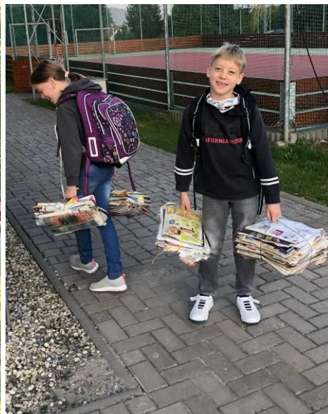
Obr. 2 Sběr – přines, co uneseš 😊