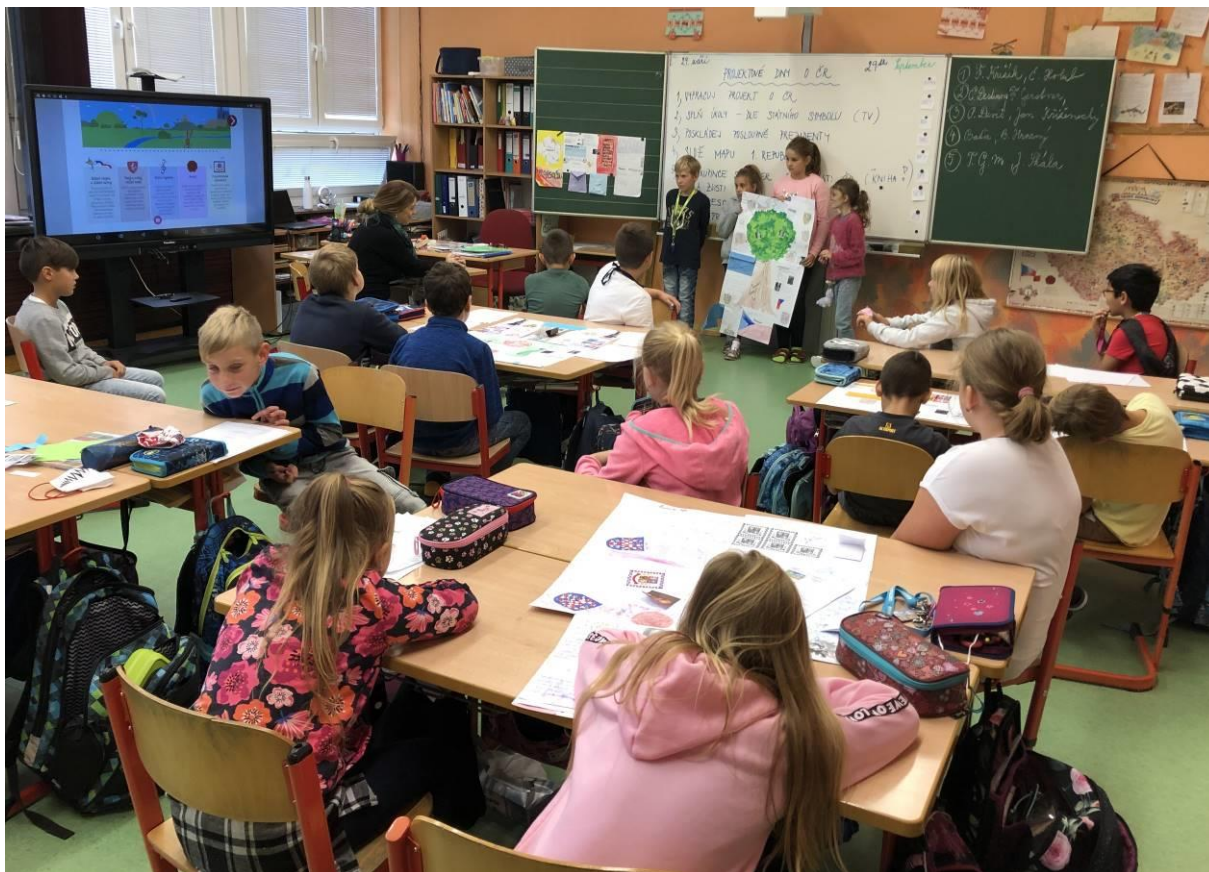
Obr. 4 Projektové dny o České republice