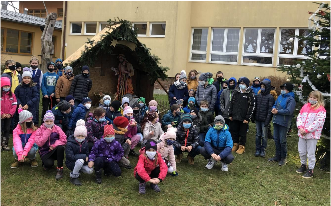
Obr. 6 Před Vánocemi