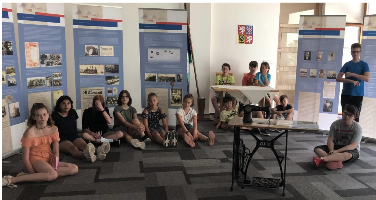
Obr. 15 Na výstavě na obecním úřadě