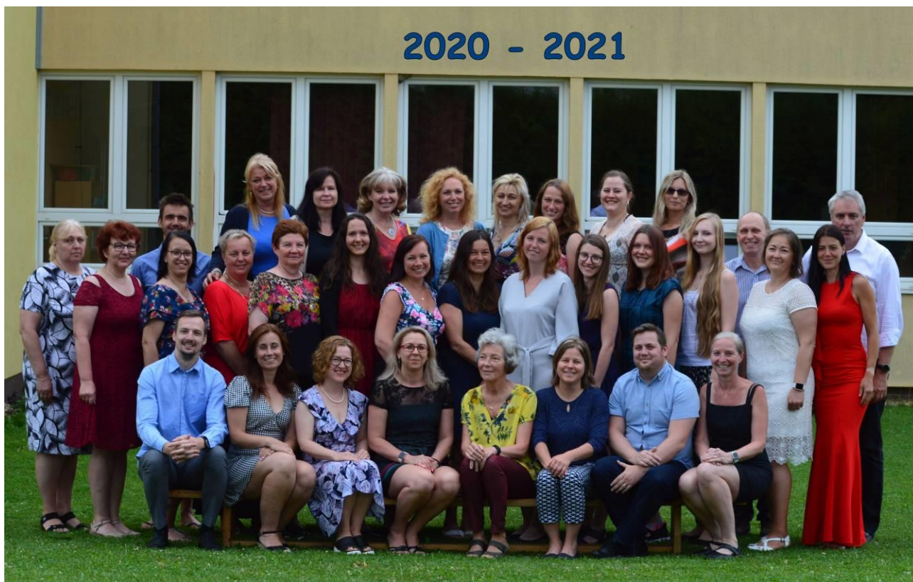
Obr. 19 Na konci školního roku