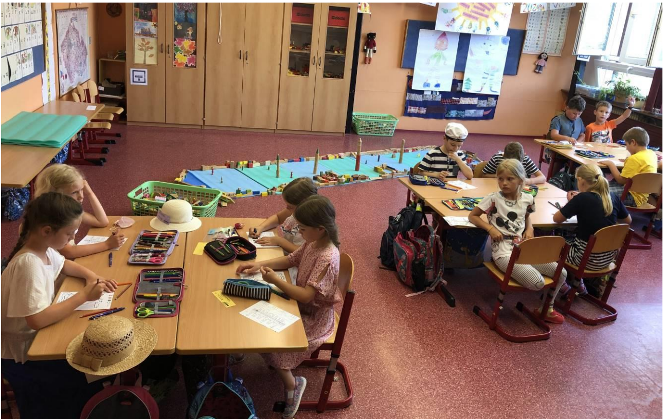
Obr. 12 Projektový den Titanik v II.A