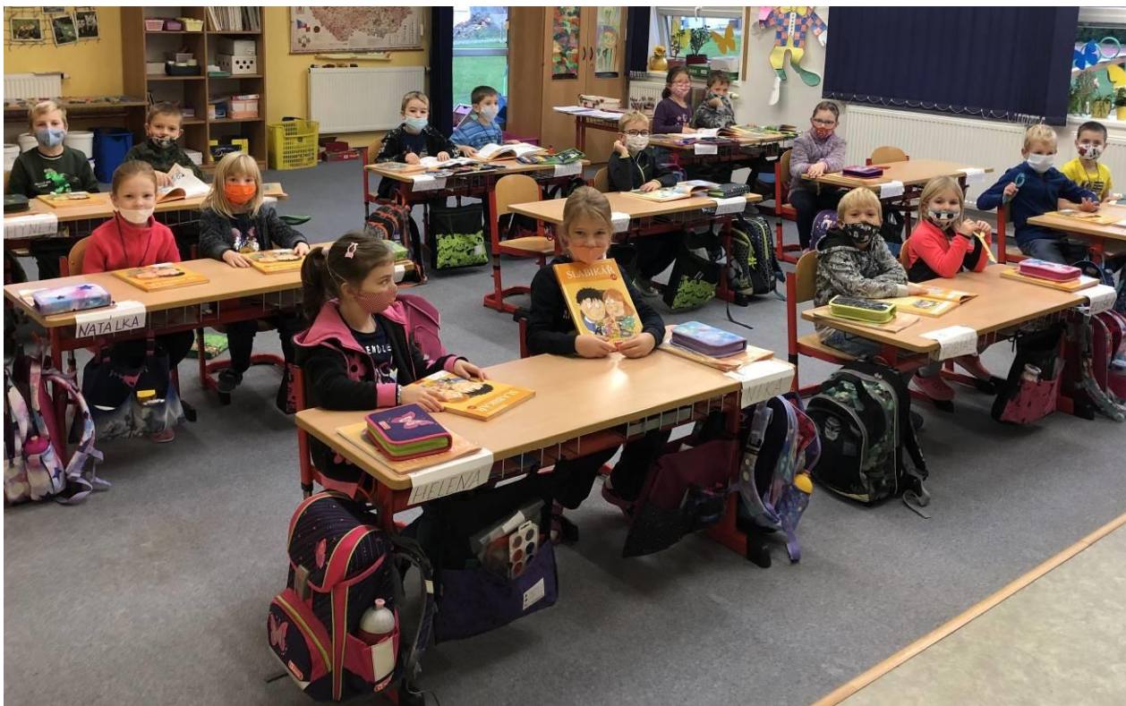
Obr. 9 Předávání slabikářů I.A