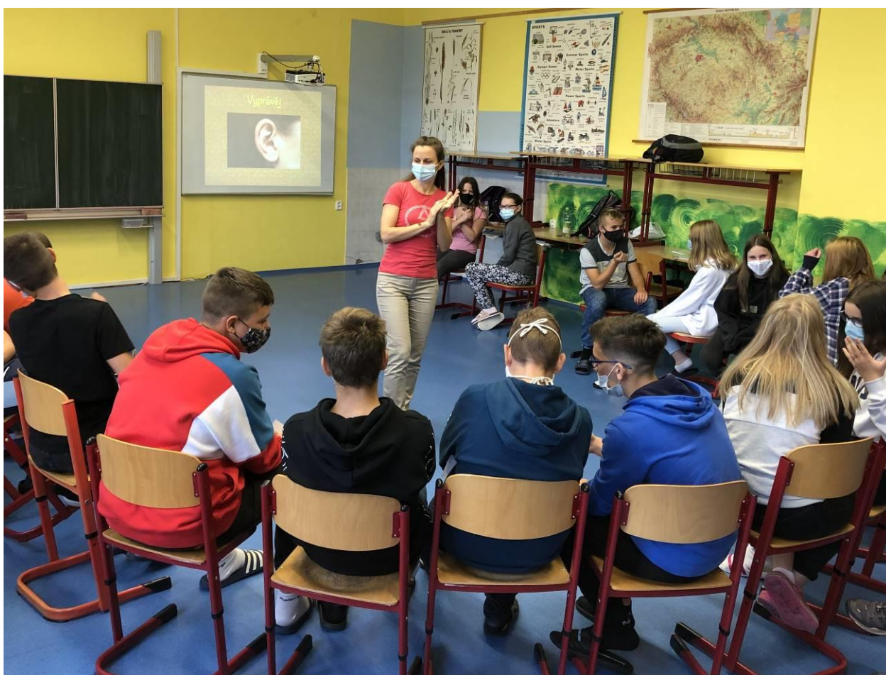
Obr. 3 Exittour

Základní škola a Mateřská škola Nový Malín, příspěvková organizace