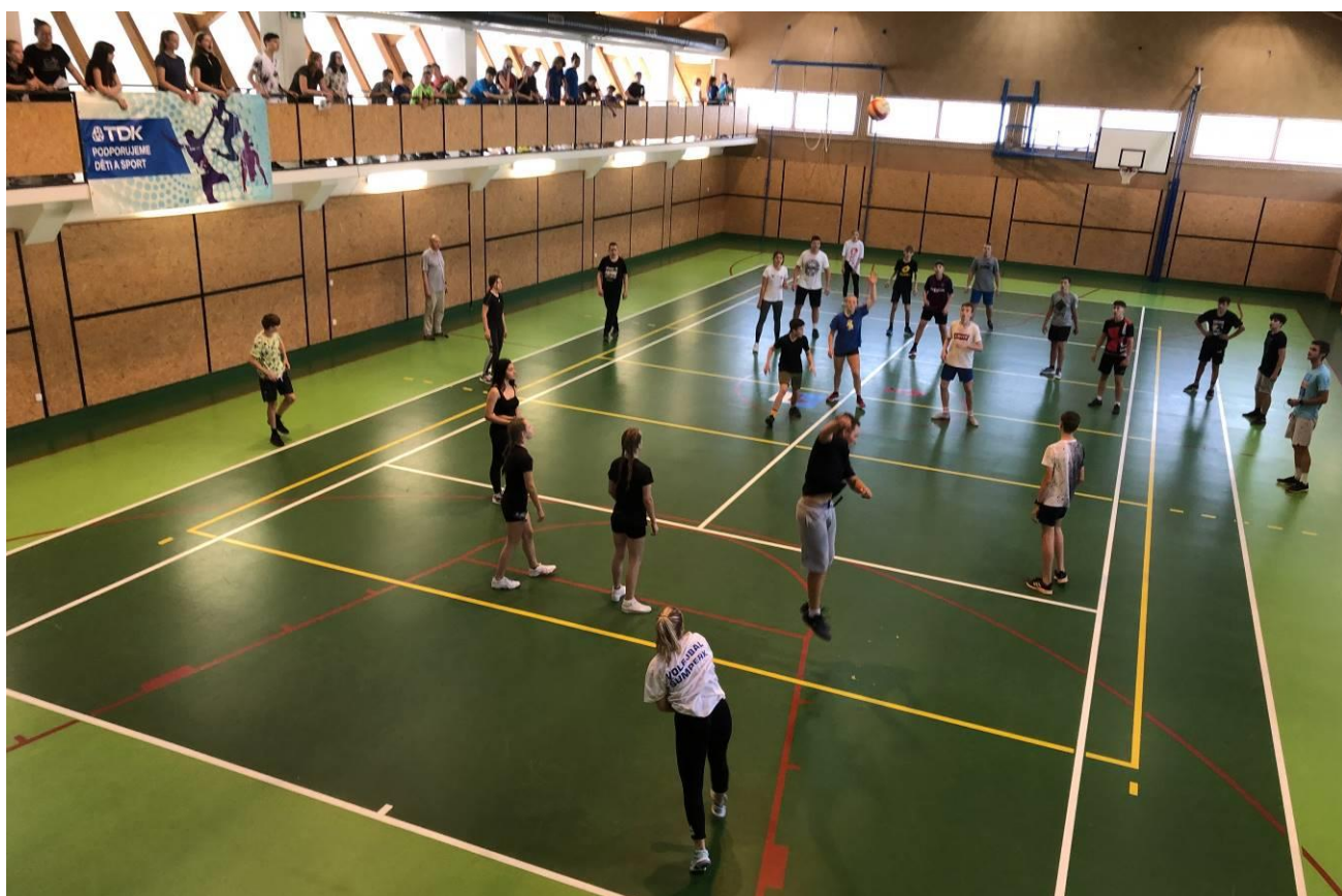
Obr. 16 Vánoční vyběžená o dort ředitelky školy (uskutečněno 24. června 😊)