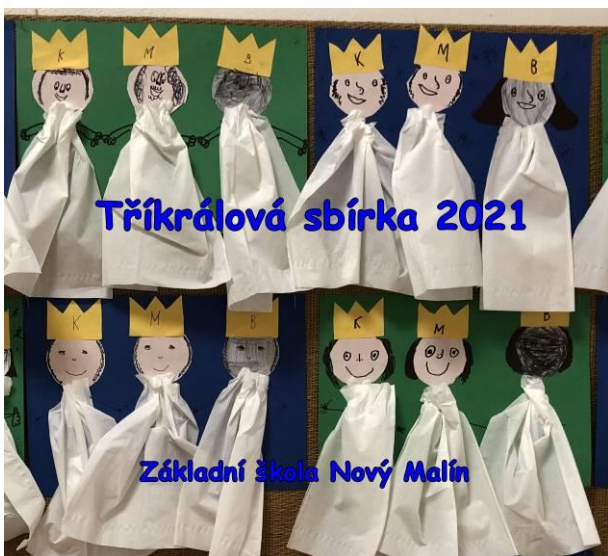
Obr. 7 Tříkrálová sbírka ve škole