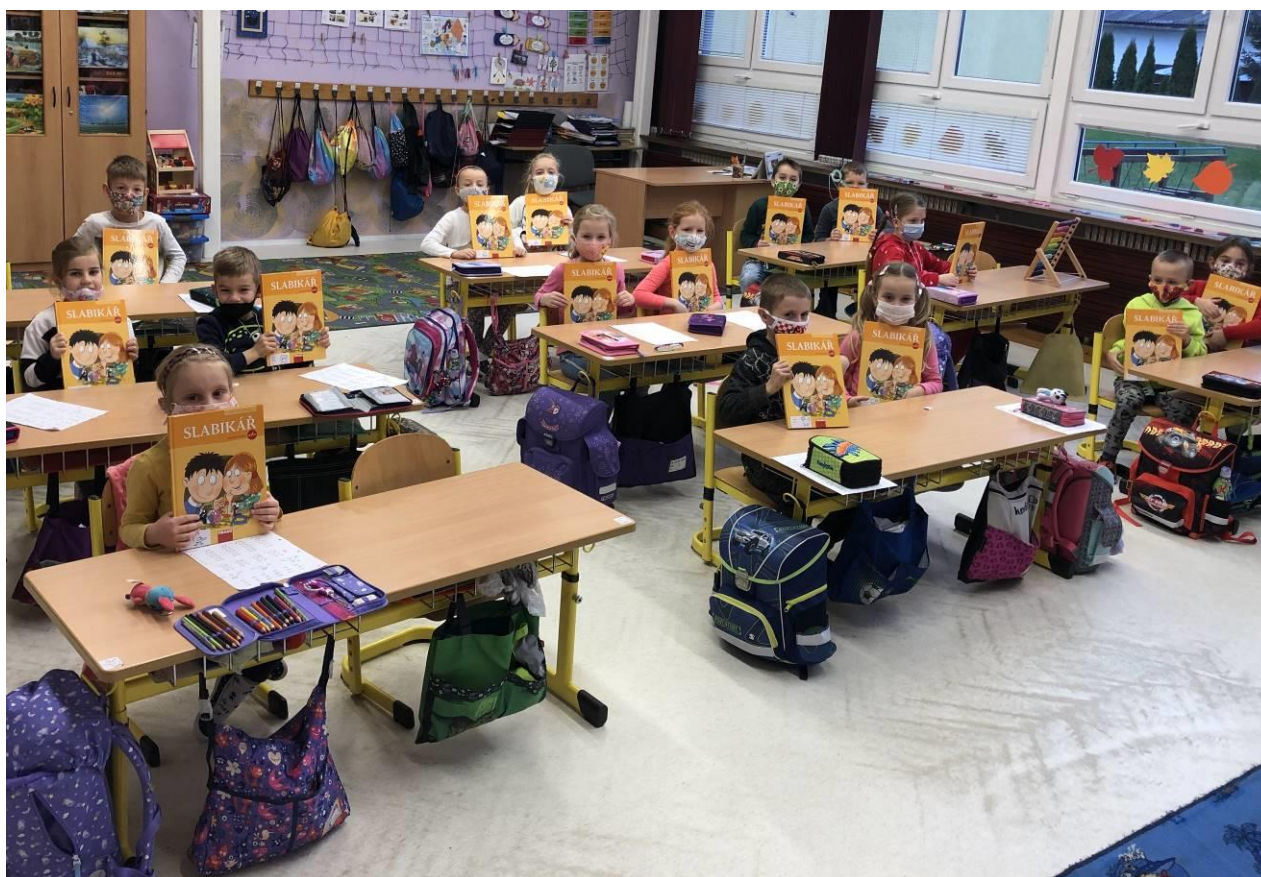
Obr. 10 Předávání slabikářů I.B