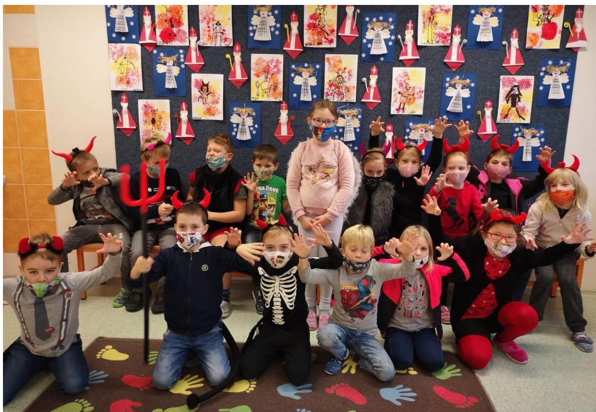
Obr. 5 Mikulášská besídka v družině