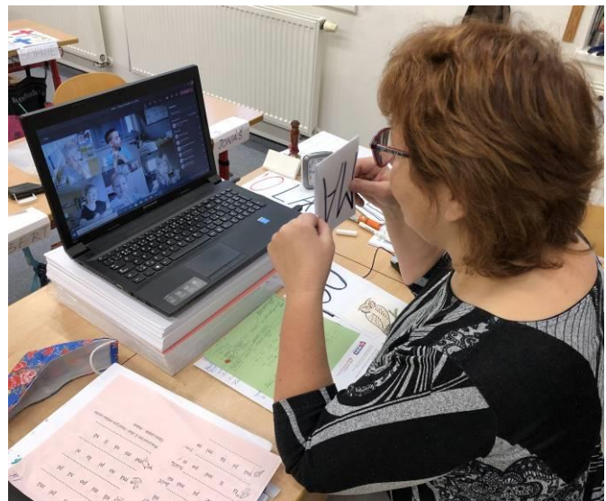
Obr. 8 Asynchronní výuka přes Microsoft Teams