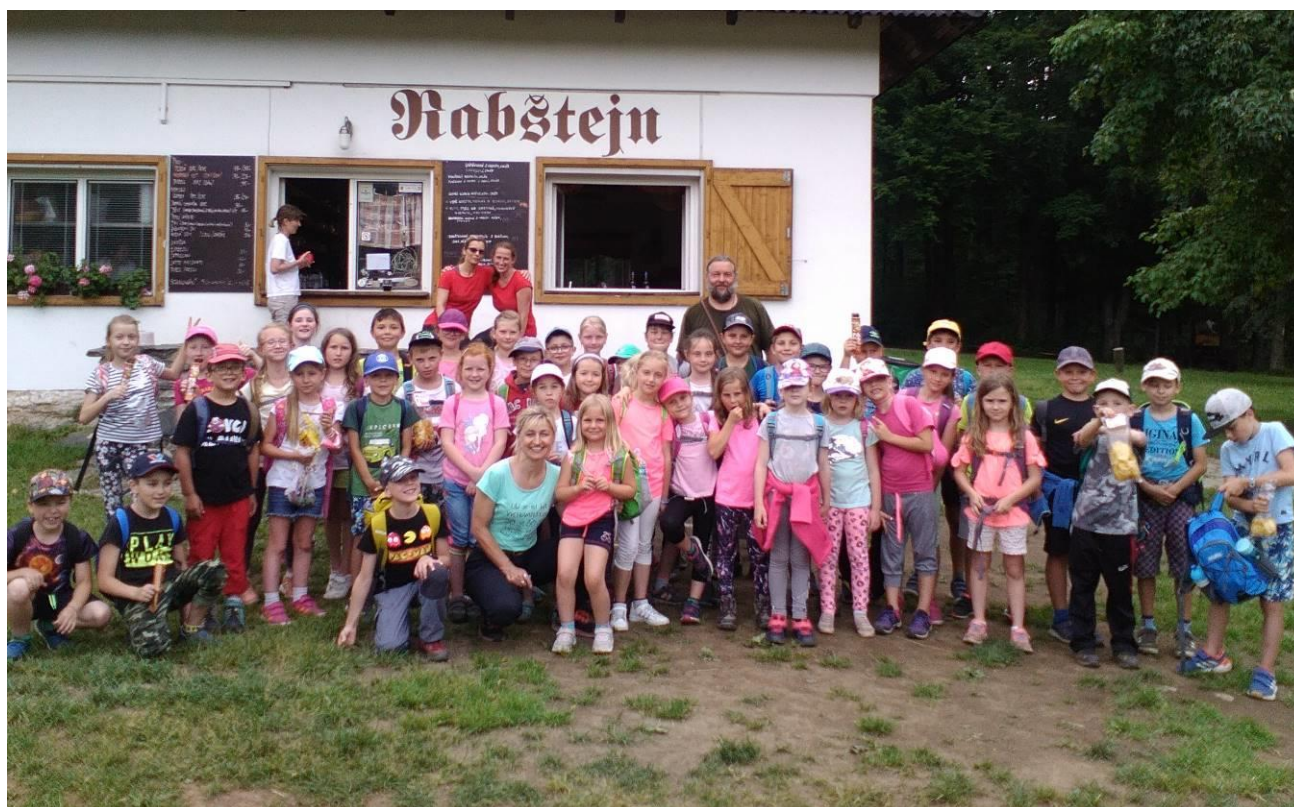
Obr. 14 Výlet s družinou