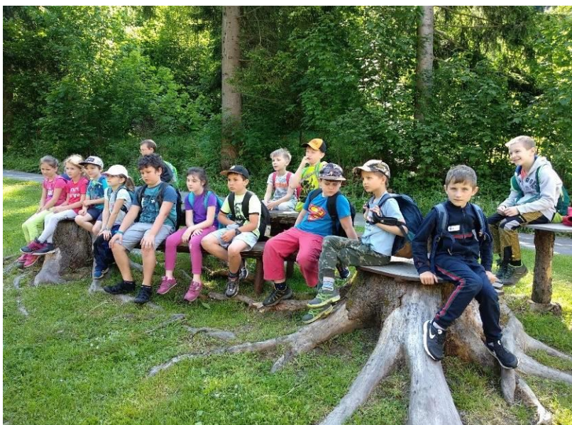
Obr. 1 Škola v přírodě - Švagrov