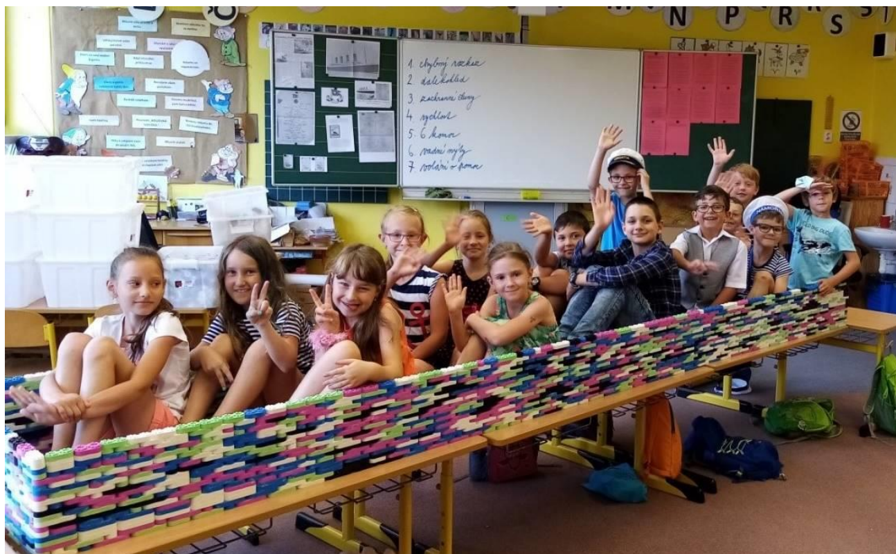
Obr. 13 Projektový den Titanik v II.B