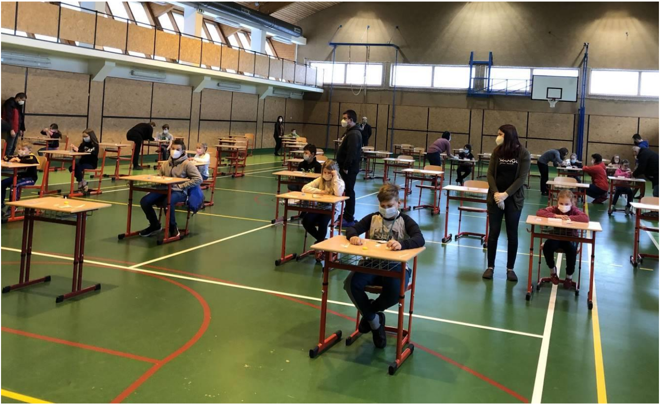
Obr. 11 Samotestování v tělocvičně