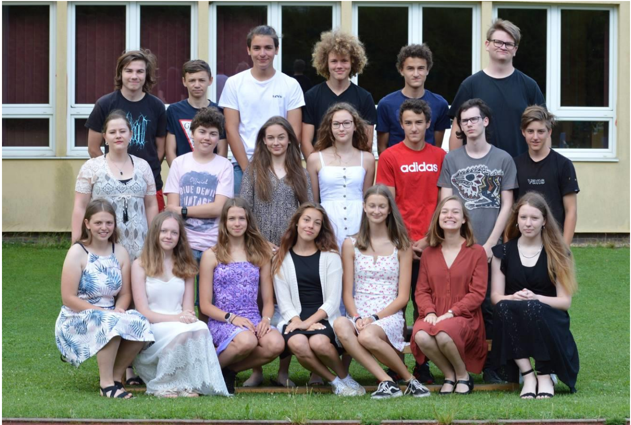
Obr. 18 IX.B také