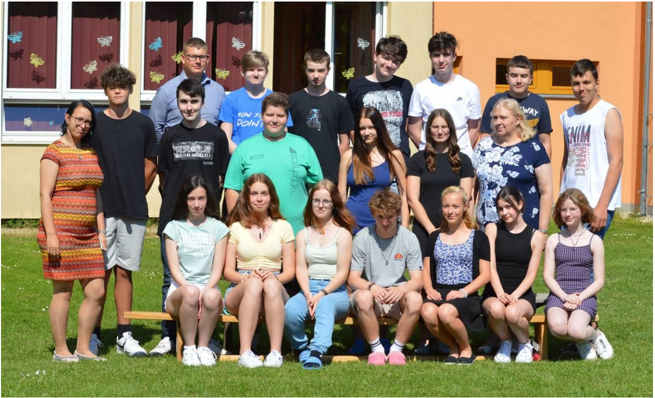
Obr. 17 IX.A se loučí